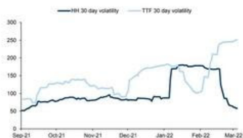
Exhibit 1: US gas price volatility has been high in recent months, but largely disconnected from the recent escalation of the European energy crisis Rolling 30-day volatility