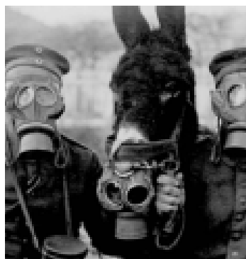
LA TERCERA GUERRA MUNDIAL. F. Javier Blasco